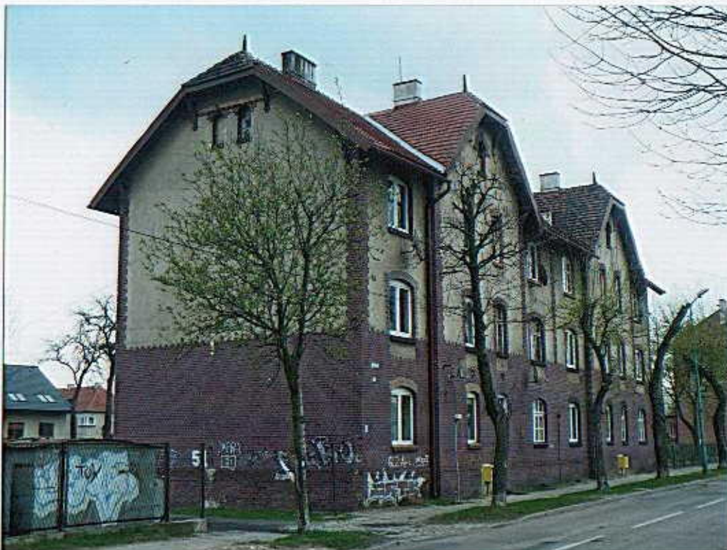
Widok od południa.

8. Fotografia z opisem wskazującym orientację albo mapa z zaznaczonym stanowiskiem archeologicznym