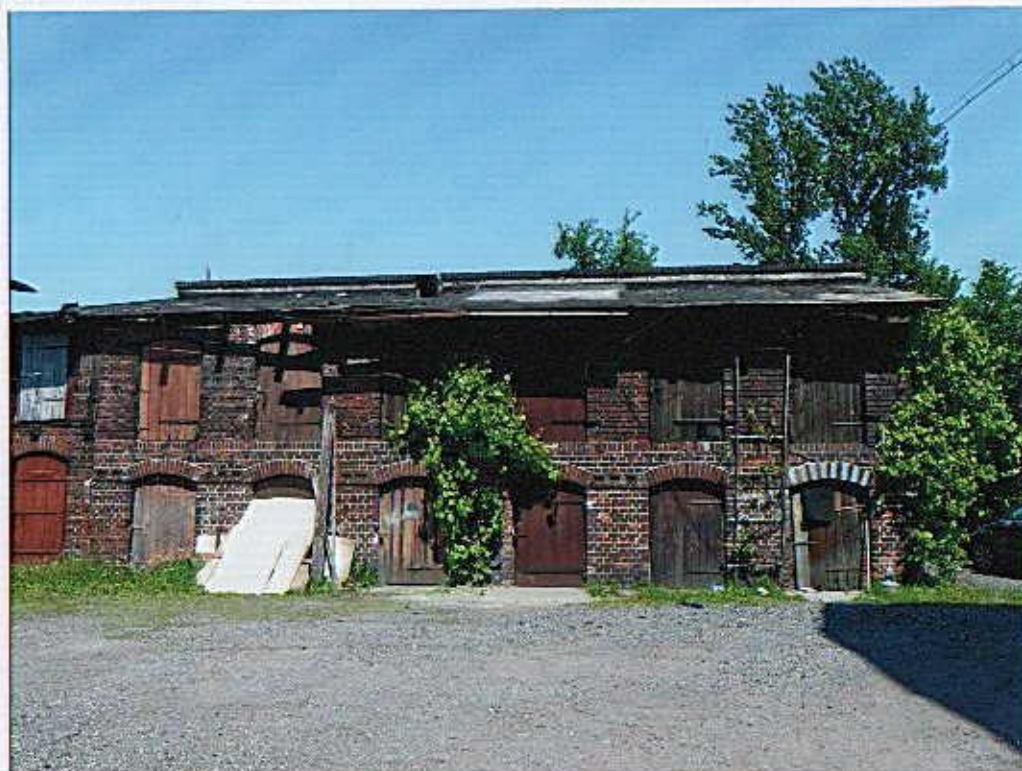
Budynek gospodarczy – widok od południa.