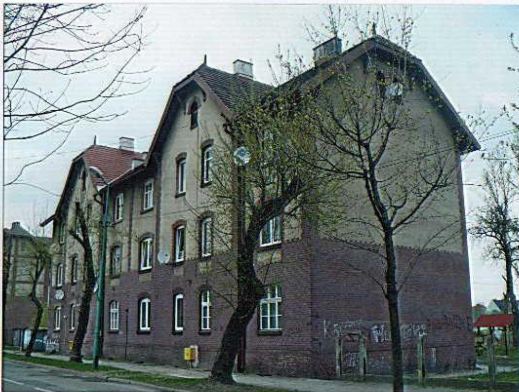
Widok od południa.

B. Fotografia z opisem wskazującym orientację albo mapa z zaznaczonym stanowiskiem archeologicznym