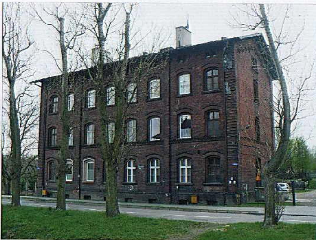
Widok od północnego-zachodu.

8. Fotografia z opisem wskazującym orientację albo mapa z zaznaczonym stanowiskiem archeologicznym