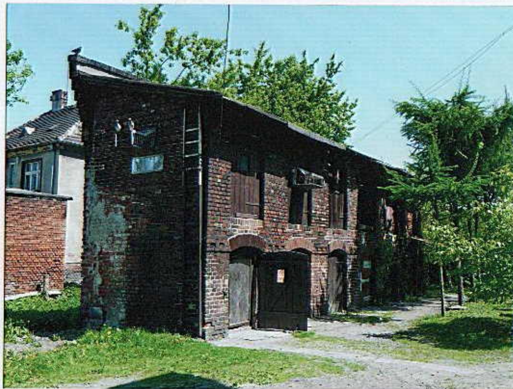
Budynek gospodarczy – widok od południowego-zachodu.