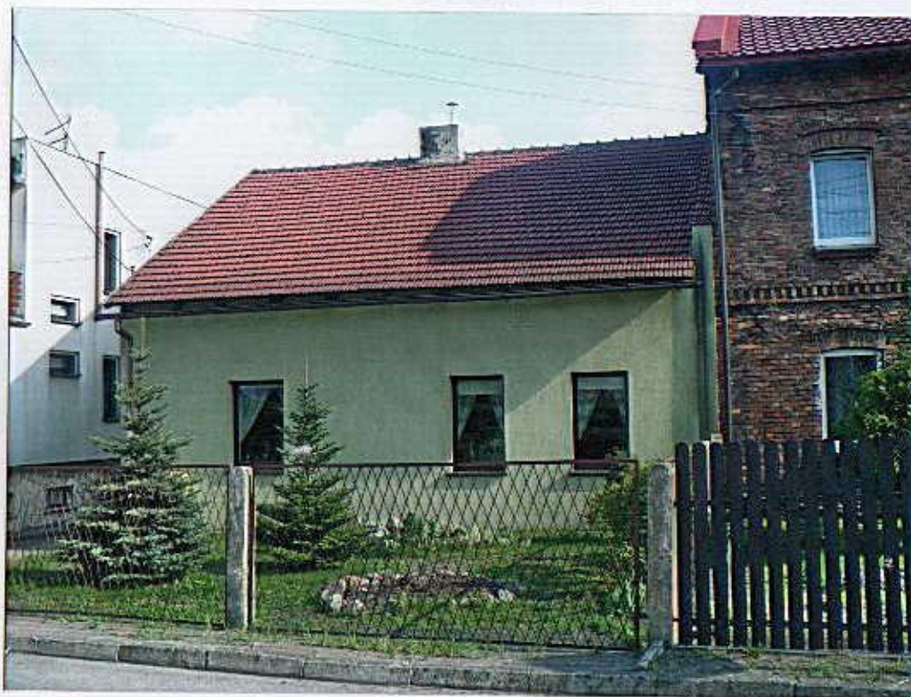
Widok od północy.

8. Fotografia z opisem wskazującym orientację albo mapa z zaznaczonym stanowiskiem archeologicznym