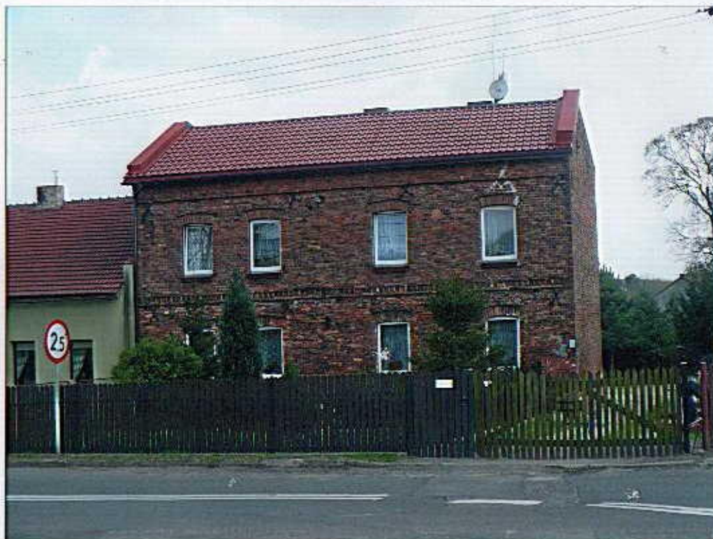
Widok od północy.

8. Fotografia z opisem wskazującym orientację albo mapa z zaznaczonym stanowiskiem archeologicznym