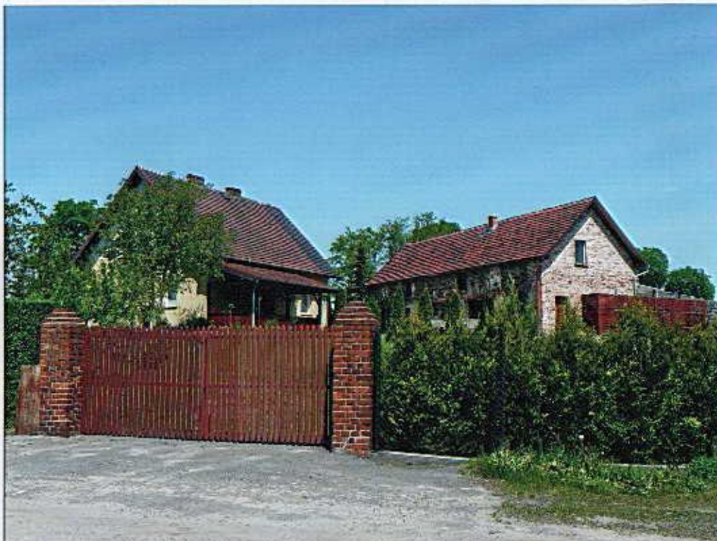
Widok od południowego- wschodu.

8. Fotografia z opisem wskazującym orientację albo mapa z zaznaczonym stanowiskiem archeologicznym