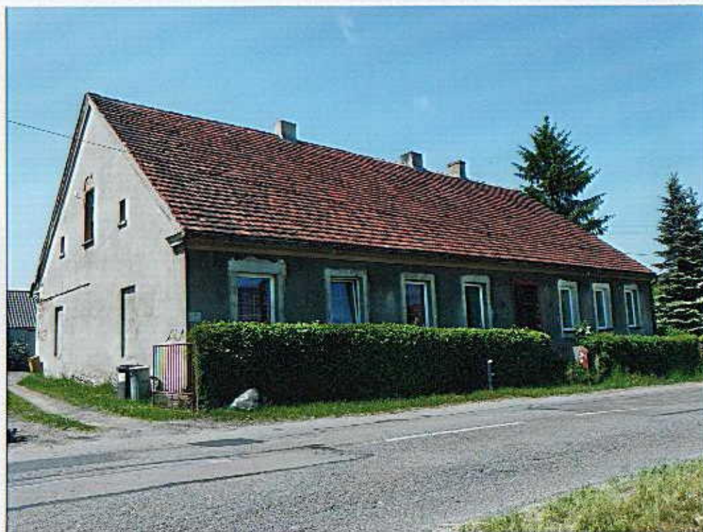
Widok od południowego- wschodu.

8. Fotografia z opisem wskazującym orientację albo mapa z zaznaczonym stanowiskiem archeologicznym