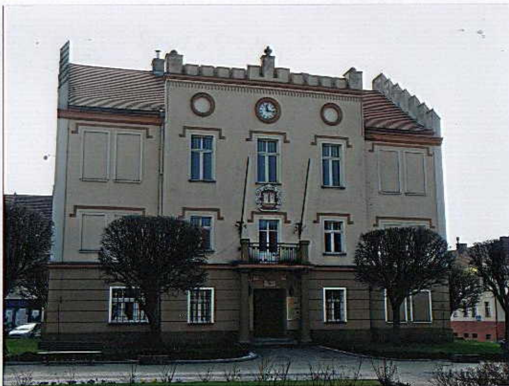
Widok od północnego- wschodu.

8. Fotografia z opisem wskazującym orientację albo mapa z zaznaczonym stanowiskiem archeologicznym