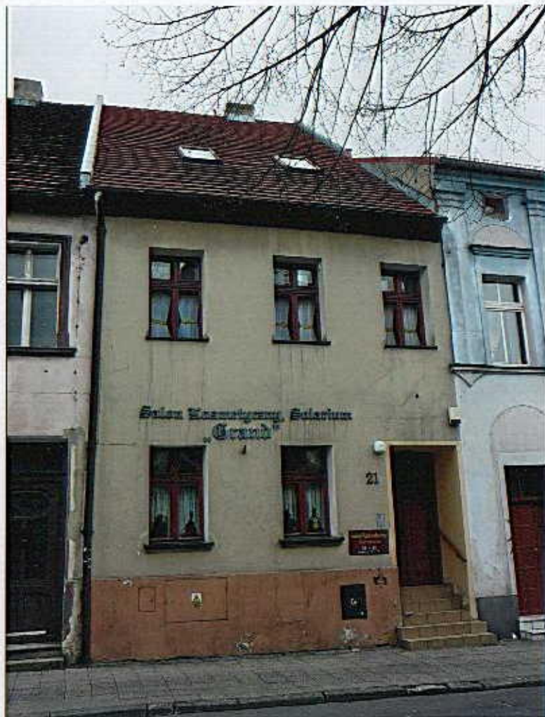
Widok od północnego-wschodu.

8. Fotografia z opisem wskazującym orientację albo mapa z zaznaczonym stanowiskiem archeologicznym